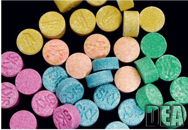
Afb.2. Ecstasypillen-pillen hebben verschillende kleuren, vormen en logo's.

was dit percentage bijna 2 keer zo hoog als voor vrouwen (respectievelijk 3,7% en 2,1%). Desgevraagd, gaf 0,5% van de onderzochte mannen en vrouwen aan zelfs de afgelopen maand XTC te hebben gebruikt (Nationale Drugmonitor, 2002). In de grote steden liggen de percentages gebruikers aanzienlijk hoger dan elders in Nederland. Zo rapporteerde 8,7 % van de Amsterdamse en 4,3% van de Rotterdamse bevolking ooit XTC te hebben gebruikt. In niet-stedelijke gebieden was dit slechts 1,4%. Ecstasy is vooral populair onder jonge volwassenen met een leeftijd tussen 20 en 24 jaar. In deze leeftijdscategorie heeft 13,2% ooit XTC gebruikt (Nationale Drugmonitor, 2002).