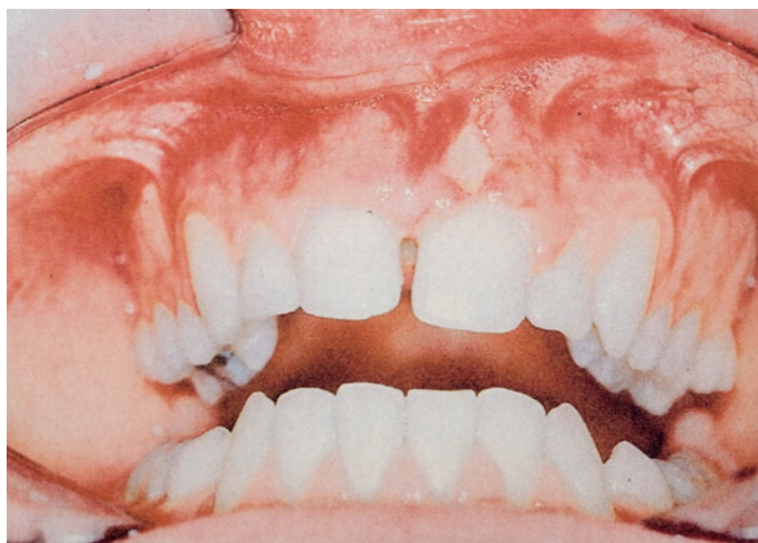
Afb.3. Mucosale fenestratie ter hoogte van gebitselement 21 door lokale applicatie van XTC (overgenomen uit Brazier et al, 2003).

komt, wordt aanbevolen isotoon vocht te drinken (sportdranken), omdat hypotone dranken ook hyponatriëmie kunnen veroorzaken (Pennings et al, 1998; Hoorn, 2003).