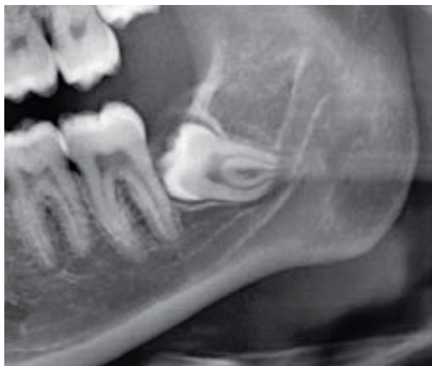
Afb. 1. Deel van een panoramische röntgenopname toont een verhoogd risico voor beschadiging van de nervus alveolaris bij chirurgische verwijdering van gebitselement 38.