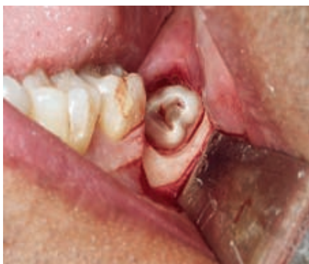
Afb. 3. Klinisch beeld peroperatief bij coronectomie.

De gemiddelde vervolgperiode was 16,7 maanden met een spreiding van 3 tot 62 maanden.