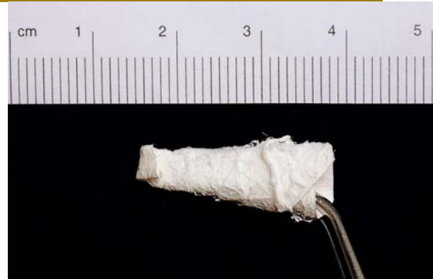
Afb. 1. Uiteinde puntzak omgeslagen.

Ter voorkoming van deze nadelen werd een nieuwe, eenvoudige en kortdurende behandelwijze zonder primaire chirurgische sluiting van de antrumperforatie toegepast bij een aantal patiënten. Hierbij is gebruikgemaakt van een bioresorbbaar Bio-Gide®-membraan, bestaande uit varkenscollageen type I en III, waarmee de alveole werd opgevuld. Dit membraan is opgebouwd uit 2 lagen: een ruwe, poreuze zijde die zorgt voor integratie en stabilisatie van botcellen en een gladde zijde die ingroei van bindweefsel in het membraan moet voorkomen. Deze gladde zijde werd nu echter naar binnen gevouwen. Onderzoeken laten zien dat het Bio-