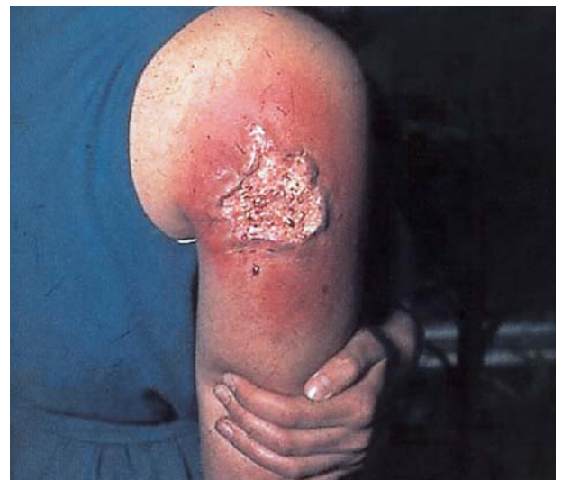
Afb. 3. Het wondoppervlak van een gegeneraliseerde parodontitis kan dezelfde afmetingen bezitten als het wondoppervlak op de foto.

Parodontitis is in een aantal opzichten een unieke vorm van infectie. Deels heeft dit te maken met het feit dat een gemineraliseerde structuur (de tand) door dekweefsel naar buiten treedt, zodat een deel bloot staat aan invloeden van buitenaf terwijl een ander deel is ingebed in bindweefsel. De tand vormt een oppervlak dat door bacteriën kan worden gekoloniseerd. In tegenstelling tot andere dekweefsels schilfert het tandoppervlak niet af en