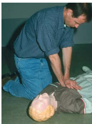
Afb. 1. b. Het verrichten van uitwendige hartmassage.