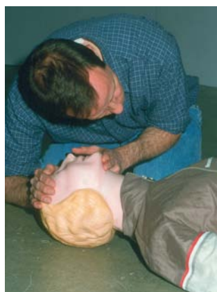
Afb. 1. a. Het openen van de luchtweg.