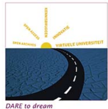
Infrastructuur van het DARE-programma.

Met www.darenet.nl komt men op de homepage. Uit de