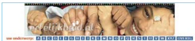
Fotocompositie op de homepage van erfelijkheid.nl.

Vanaf de website van het Erfocentrum komt men via de link 'Websites' in het rechtermenu in een lijst waar een verwijzing staat naar www.erfelijkheid.nl . Op de homepage van deze website is te lezen dat men objectieve en betrouwbare informatie wil geven over erfelijkheid, erfelijke ziekten en aandoeningen, zwangerschap en kinderwens in relatie tot erfelijkheid. Verder bevat de homepage het actuele nieuws in de vorm van persberichten die het Erfocentrum heeft uitgegeven en op het rechterdeel van het scherm staat een venster waar vragen kunnen worden gesteld en waar men zich