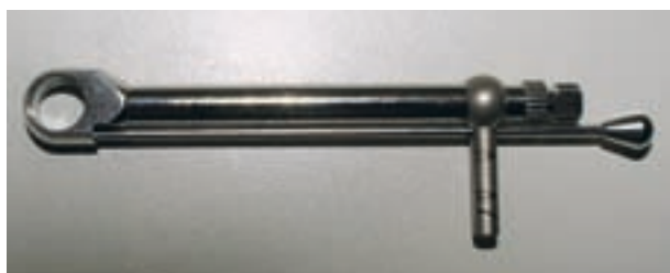
Afb. 1. Momentsleutel voor het tot het geadviseerde maximale torsiemoment vastdraaien van een implantaatopbouwschroef.

nectie aanwezig is, in tegenstelling tot de externe connectie bij veel andere implantaatsystemen. Een interne connectie biedt mogelijk meer weerstand tegen het loskomen van de opbouwschroef dan een externe. Twee onderzoeken met kleine aantallen patiënten naar enkeltandsvervanging door een Astra®-implantaat lieten na 3 en 5 jaar geen enkele losgekomen schroef zien (Palmer et al, 2000; Cooper et al, 2007). Over Straumann®-implantaten bestaat in dit opzicht geen informatie.