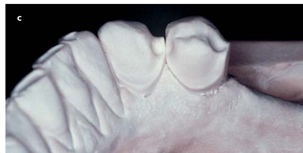
Afb. 6. Frameprothese met 'inlayed' verankering op de gebitselementen 34, 43 en 44 (a en b) en werkmodel met vormgeving van de uitsparing (c).

al, 1996; Creugers en Kreulen, 2003; Van Loveren, 2009). De primaire vragen zijn dus niet alleen of en hoe ontbrekende gebitselementen kunnen worden vervangen, maar vooral door welke maatregelen verder gebitsverval kan worden voorkomen (Petridis en Hempton, 2001).