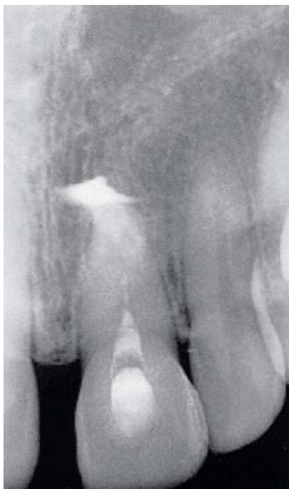
Extrusie van vulmateriaal bij endodontische behandeling (Bron: Ned Tijdschr Tandheelkd 2005; 112: 427-435).