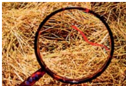
Een speld in een hooiberg zoeken http://www.ntvt.nl/zoeken/index.asp