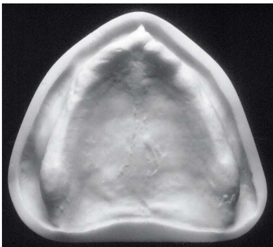
Afb. 4. Model waarmee de verregaande atrofie van de processus alveolaris maxillae kan worden geïllustreerd.

hindernis van de processus alveolaris, de medische conditie, het gebruik van medicamenten, een afwijkende maxillomandibulaire relatie (afb. 3). Ook in de daarop volgende behandelsessies speelt voorlichting een belangrijke rol. Door de patiënt bijvoorbeeld de modellen van de kaken te tonen om de (beperkte) omvang van de processus alveolaris te laten voelen, krijgt de patiënt een indruk van de problemen waarmee de zorgverlener wordt geconfronteerd (afb. 4).