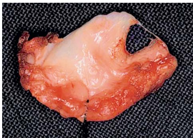
Afb. 4. Chirurgisch verwijderde discus articularis van het kaakgewricht met een perforatie.

Bij onderzoek naar aandoeningen van het kaakgewricht is de noodzaak onderkend om op methodologisch correcte wijze klinisch onderzoek te verrichten. De beginselen van klinimetrie werden toegepast en nader tot ontwikkeling gebracht (Stegenga, 1991). Van der Kuijl (1992) toonde aan dat kwalitatief goede beeldvorming van de kaakgewrichten van groot belang is om te komen tot een juiste diagnose van een aandoening van het kaakgewricht. De hypothese dat hypermobiliteit leidt tot osteoartrose op jonge leeftijd is onderzocht en verworpen voor het kaakgewricht. Jonge