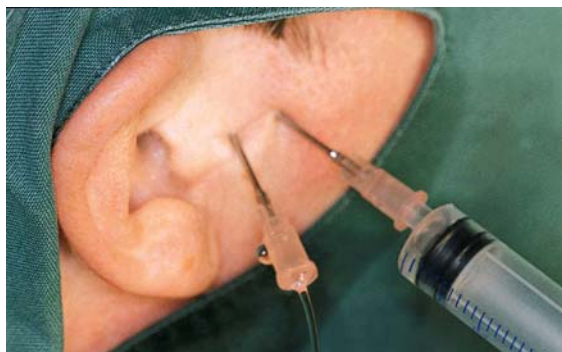
Afb. 1. Artrocentese. In de bovenste gewrichtskamer zijn 2 naalden ingebracht, 1 om de spoelvoelstof (fysiologisch zout) in te brengen, de andere om de spoelvoelstof te laten afvloeien.

culair kraakbeen van gezonde capita mandibulae bestudeerd en in kaart gebracht. De resultaten hiervan werden vergeleken met obductiemateriaal verkregen uit articulaire kraakbeen van artrotische capita, dat op dezelfde wijze voor lichtmicroscopie en scanningelektronenmicroscopie werd bewerkt. Deze artrotische capita waren afkomstig van patiënten die een hoge condylectomie hadden ondergaan. Al het patiëntenmateriaal werd tevens bewerkt voor transmissie-elektronenmicroscopie om het ultrastructurele beeld te krijgen van cellen en matrix van osteoartrotisch kraakbeen. De ultrastructurele bevindingen werden vergeleken met de ultrastructuur van articulaire kraakbeen van niet-artrotische capita die waren verwijderd bij oncologische behandelingen, waarbij in verband met een maligne proces in de ramus mandibulae een hemimandibulectomie werd verricht.