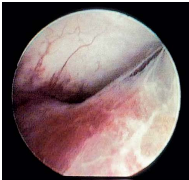
Afb. 5. Arthroscopisch beeld van de bovenste gewrichtskamer van een kaakgewricht met duidelijke kenmerken (roodheid) van een inflammatoire gewrichtsaandoening.

vrouwen met degeneratieve veranderingen van de kaakgewrichten bleken opvallend lenig te zijn, maar niet significant leniger dan een controlegroep van dezelfde leeftijd (Dijkstra, 1993).