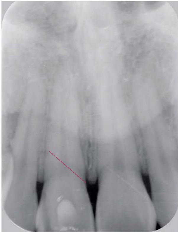
Afb. 2. Periapicale opname van gebitselementen 11 en 21, waarbij de rode stippellijn de verticale wortelfractuur aangeeft.