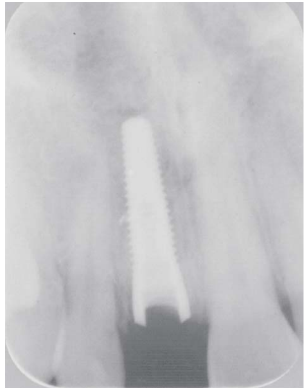
Afb. 5. Röntgenopname 4 maanden na plaatsing van het implantaat.