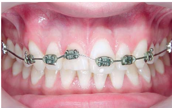
Afb. 3. Vaste orthodontische apparatuur geplaatst op de frontelementen, waarbij de bracket op gebitselement 11 naar gingivaal is gepositioneerd om extrusie mogelijk te maken.