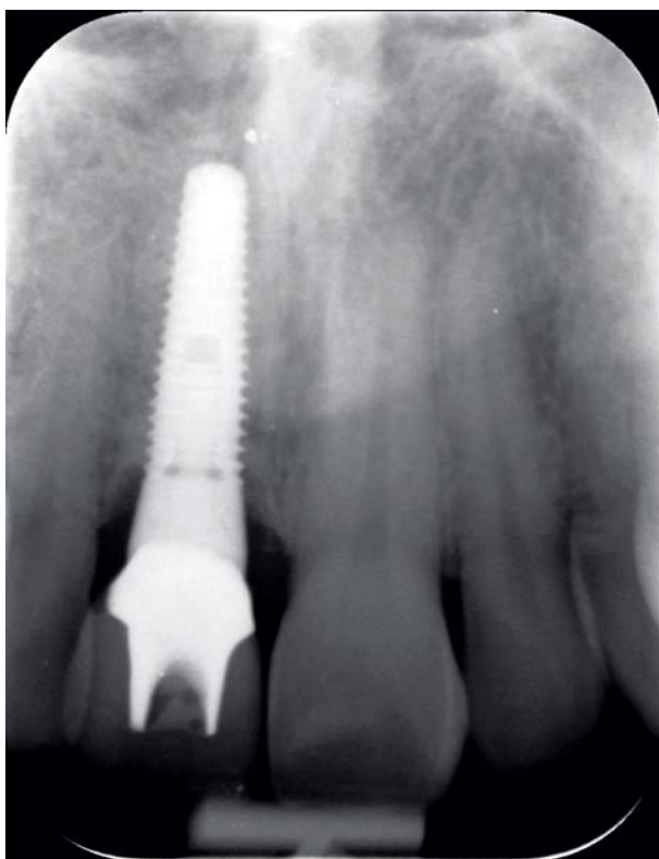
Afb. 7. Röntgenopname van implantaat 9 jaar na plaatsing.