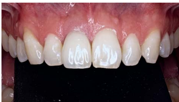
Afb. 8. Intraorale opname met implantaatkroon in situ 9 jaar na plaatsing.

herplaatst en de behandeling herhaald. Na 6 maanden was de gingiva ten opzicht van het buurelement ongeveer 6 mm verplaatst (afb. 4). Op dit moment werd de orthodontische apparatuur verwijderd en immmediaat een implantaat geplaatst (Nobel Perfect RP 4.3 x16). Vier maanden na plaatsing vertoonde het implantaat een goede osseointegratie en werd gestart met het vervaardigen en vervolgens cementeren van de implantaatkroon (afb. 5 en 6). Negen jaar na plaatsing van het implantaat zijn bot en weke delen stabiel gebleven (afb. 7 en 8).