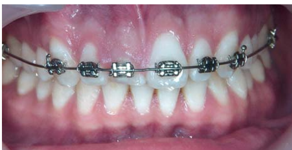
Afb. 4. Zes maanden na behandeling is de gingiva ten opzichte van het buurelement 6 mm naar incisaal verplaatst.

De behandeling van gebitselement 11 bestond in eerste instantie uit het openen en reinigen van het wortelkanaal om infectie te voorkomen. Het kanaal werd gevuld met calciumhydroxide.