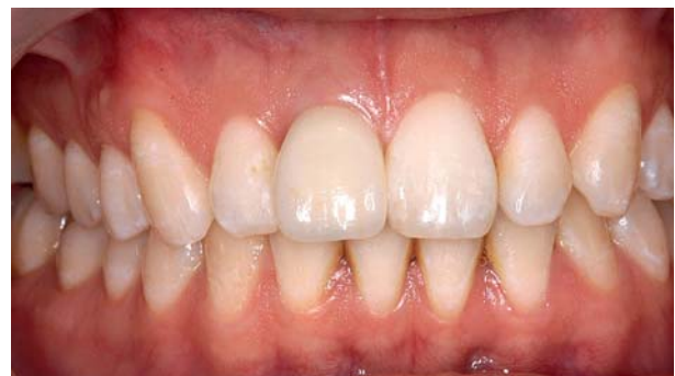
Afb. 6. Implantaatkroon in situ .