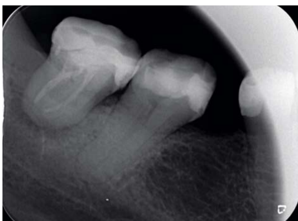
Afb. 3. Een endodontisch behandeld gebitselement 48 met parodontitis apicalis, conische radices, indicatie voor intentionele replantatie (met dank aan J.M. van Ingen).