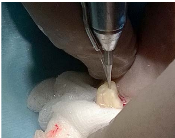
Afb. 5. Retrograde preparatie van de wortelkanalen.