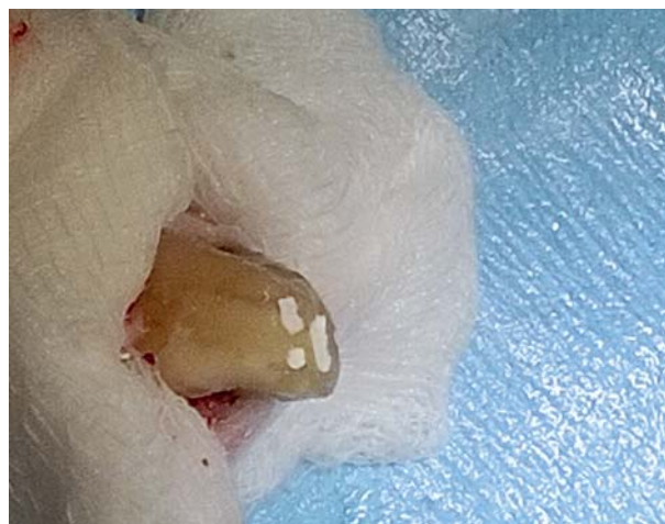
Afb. 6. IRM-restauraties in situ .