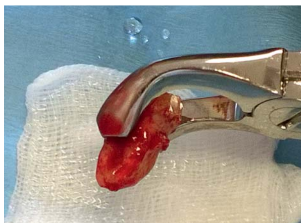
Afb. 4. Extractie van gebitselement 48 met tang.

endodontische behandelingen, waarbij onderzoek inzicht heeft gegeven in de factoren die het slagen van een endodontische (her)behandeling beïnvloeden.