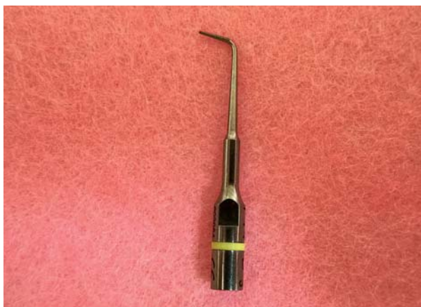
Afb. 1. Ultrasonie tip (5 mm) voor het uitvoeren van retrograde apexresecties