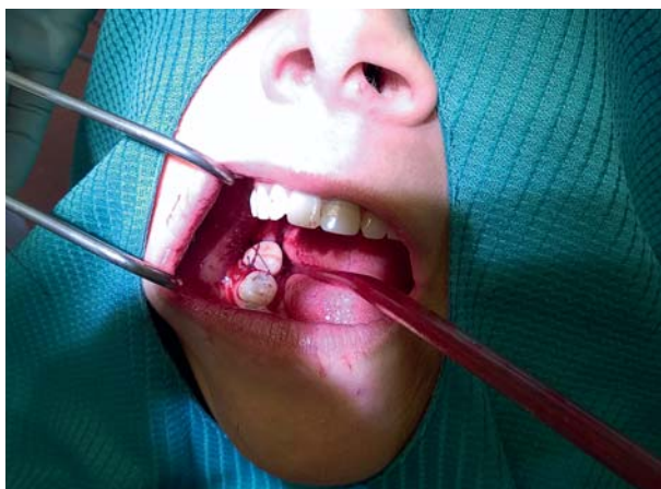
Afb. 7. Het gebitselement gereplanteerd, fixatie met hecht draad.

als endodontische herbehandelingen beschrijven. Helaas ontbreekt bij deze onderzoeken vrijwel altijd een controlegroep en zijn de definities van succes nogal verschillend en vaak slecht gevalideerd. Daardoor zijn de uitkomsten onderling eigenlijk niet te vergelijken en kan men alleen trends herkennen. Dit geldt vooral voor de publicaties over apexresecties omdat daarover al vele decennia wordt gepubliceerd, terwijl onderzoeksliteratuur over de endodontische herbehandeling relatief jong is. Bij apexresecties ziet men een gestage toename van behandelingsucces: was dit in de jaren 70 van de vorige eeuw 40-50%, inmiddels is dit bij geselecteerde patiënten gestegen tot 90% wanneer men gebruikmaakt van moderne technieken, zoals vergroting, ultrasoon prepareren en nieuwe vulmaterialen (Tsisis et al, 2009)