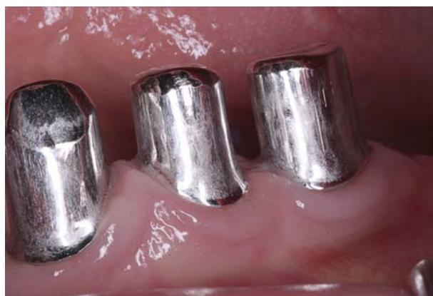
Afb. 4. Binnenzijde titanium telescoopkronen ter vervanging van de door- gesleten gouden kronen.