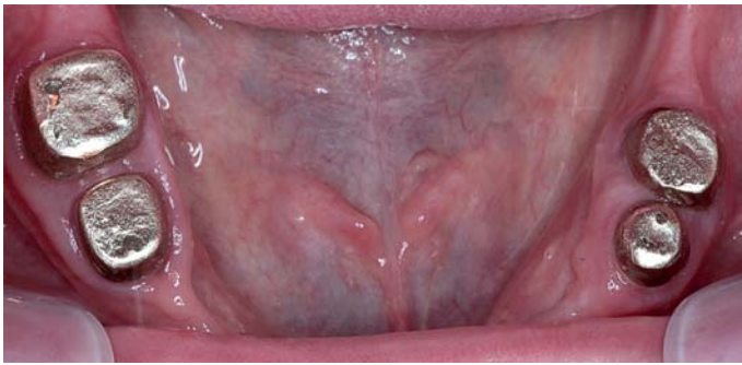
Afb. 1. Intraorale opname van telescoopkronen, 28 jaar in situ .