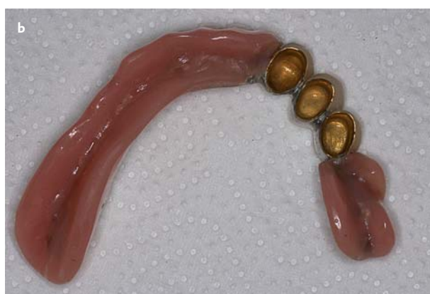
Afb. 5. a en b. Telescoopkronen 10 jaar in situ , waarbij slijtage van kronen en prothetische constructie zichtbaar is.

De maximale observatieperiode bedroeg 34 jaar en 5 maanden. Er gingen 61 prothetische constructies verloren. De mediane overleving van de telescoopprothesen in de boven- en onderkaak was respectievelijk 22,3 \pm 2,8 jaar en 20,9 \pm 1,9 jaar. Dit was het moment waarop de helft van de prothetische constructies faalde. Het curveverloop (Kaplan-Meier) tussen de boven- en onderkaak was niet statistisch significant verschillend (afb. 3).