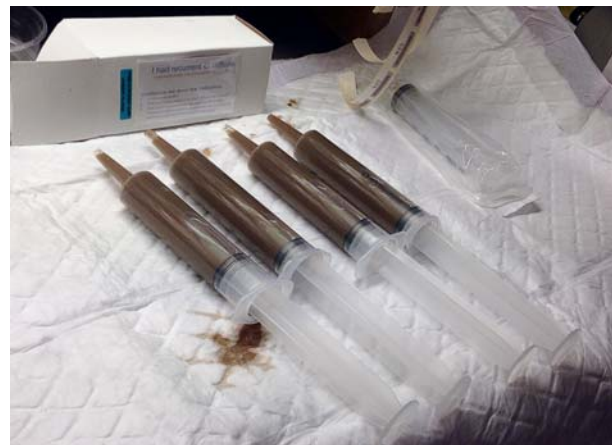
Afb. 3. Donorfecessuspensie voor infusie.

Het doel van fecetransplantatie bij CDI is om de microbiota te remediëren waardoor de kolonisatieresistentie wordt