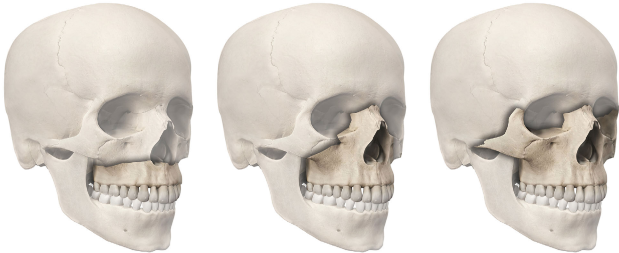
Afb. 3. De indeling van middegezichtsfracturen volgens Le Fort, met van links naar rechts het verloop van de Le Fort I-fractuur, Le Fort II-fractuur en Le Fort III-fractuur. Illustrator: Serge Steenen.

voor de hersenen, waardoor het ontstaan van traumatische hersenschade wordt voorkomen of wordt beperkt. De tweede theorie veronderstelt dat de energie die vrijkomt bij een trauma direct via de botstukken van het middegezicht naar de hersenen wordt overgebracht, waardoor traumatische hersenschade wordt veroorzaakt.