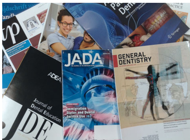
Wetenschappelijke tijdschriften en vakbladen.

Tandartsen dienen de behoeften en voorkeuren van de individuele patiënt te combineren met de best beschikbare wetenschappelijke informatie om een adequaat behandelplan te kunnen opstellen (Bader en Ismail, 2004; Teich et al, 2013). Een belangrijk uitgangspunt van het tandheelkundig curriculum is daarom het principe van evidencebased tandheelkunde, waarbij de wetenschappelijke onderbouwing essentieel is om goede zorg te kunnen bieden (Winning et al, 2008; Cowpe et al, 2009). Beschikbare