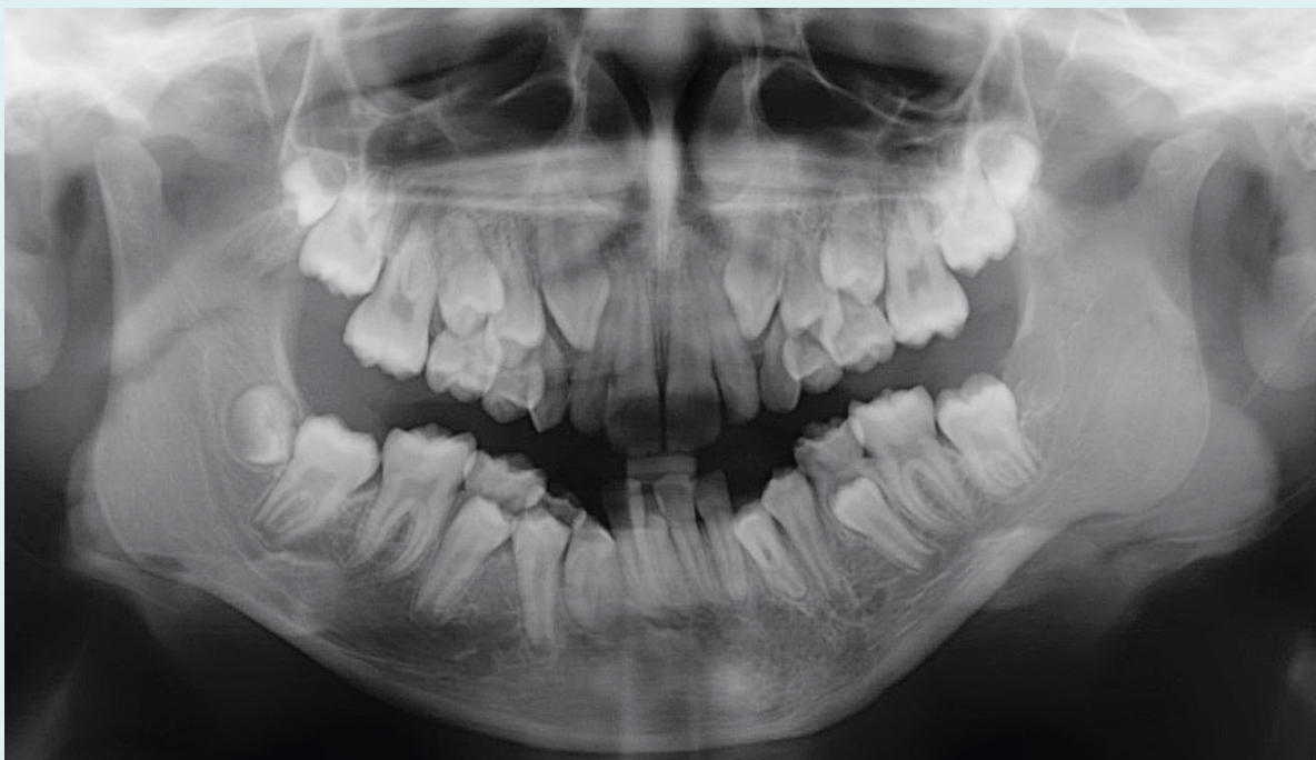
Panoramische röntgenopname: gebitselementen 13 tot en met 15 moeten nog wisselen, evenals gebitselementen 23 tot en met 25, 33 tot en met 35 en 43 en 44. Het linkerkaakkopje is afgeplat ten opzichte van rechts, hetgeen kan passen bij artritis ter plaatse.