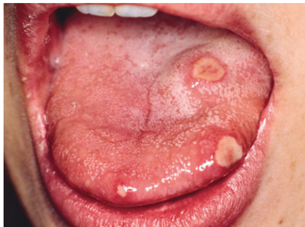
Afb. 4. Orale afters

Er is sprake van een poly-articulaire JIA wanneer er in de eerste 6 maanden van de ziekte minimaal 5 betrokken gewrichten zijn. Er wordt een indeling gemaakt in reumafactor positieve (RF+) poly-articulaire JIA en reumafactor negatieve (RF-) poly-articulaire JIA. De RF+ poly-articulaire JIA wordt gezien als de juveniele vorm van reumatoïde artritis. In Nederland komt RF+ poly-articulaire JIA maar weinig frequent voor (2-7%) en wordt vooral gezien bij meisjes, meestal op de late kinderleeftijd of in de puberteit. De aandoening presenteert zich dan met een symmetrische poly-artritis van vooral polsen en kleine gewrichten van handen en voeten die vaak leidt tot lokale schade. Snelle en intensieve behandeling is dus op zijn plaats. RF-poly-articulaire JIA lijkt een mengbeeld van 2 subtypes te