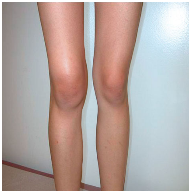
Afb. 3. Artritis van de linker knie.

hexacetonide (Lederspan TM ) of het starten van een disease modifying antirheumatic drug (DMARD). Intra-articulaire injecties worden bij jonge kinderen vaak met een vorm van sedatie of soms zelfs narcose gegeven. Er worden zelden systemische bijwerkingen gezien, wel kan er lokaal subcutane atrofie optreden. Als DMARD wordt meestal gekozen voor methotrexaat (MTX), gezien de ruime ervaring met dit middel, de bekende effectiviteit en een acceptabel bijwerkingenprofiel. De meest voorkomende bijwerkingen bij methotrexaat zijn misselijkheid en orale afters (afb. 4). Ter voorkoming van dit laatste wordt foliumzuur 1 tot 2 dagen na de methotrexaat-gift geadviseerd. Daarnaast kan er stijging van de leverenzymen en beenmergsuppressie ontstaan. Om deze reden zijn frequente bloedcontroles, vooral in de opstartfase, van belang. Bij intolerantie voor methotrexaat kan een andere DMARD overwogen worden (bijvoorbeeld leflunomide), maar hiermee is nog maar beperkte ervaring. De prognose van kinderen met een persistent oligo-articulaire JIA is goed, de ziekte dooft vaak uit en er ontstaat maar weinig schade. Het beloop bij kinderen met een extended type JIA is minder gunstig.