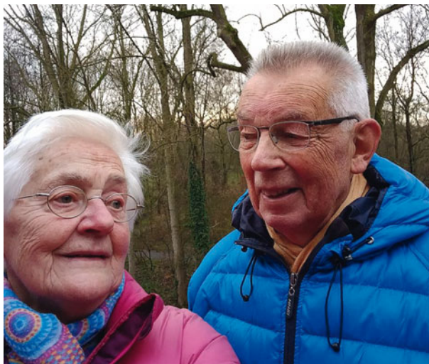
Afb. 1. Twee 65-plussers op weg naar de tandartspraktijk.

Mensen worden wereldwijd steeds ouder (WHO). Volgens het Centraal Bureau voor de Statistiek (CBS) stijgt het aantal 65-plussers in Nederland van 2,7 miljoen in 2012 naar 4,7 miljoen in 2040 (CBS Statline). In Nederland is er dan ook veel aandacht voor het toenemende aantal ouderen waarbij gezond ouder worden en langer thuis wonen hoog op de politieke agenda staat. De Algemene Wet Bijzondere Ziektekosten (AWBZ) , de Wet maatschappelijke ondersteuning (WMO) en de Zorgverzekeringswet (ZVW) zijn hiertoe recent aangepast om dit mogelijk te maken. Gemeenten