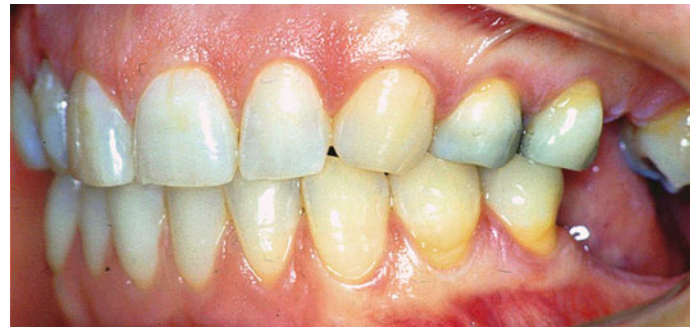
Afb. 1. Een verkorte tandboog aan de linkerzijde met 2 occlusale eenheden.

Het systematische literatuuronderzoek naar de invloed van afwezige gebitselementen op de mondgezondheidgerelateerde levenskwaliteit leverde uiteindelijk 45 artikelen op. Hiervan konden 10 artikelen worden gebruikt voor 6 meta-analyses. Alle geïnccludeerde artikelen en meta-analyses lieten zien dat het verlies van gebitselementen geassocieerd was met verlies van de mondgezondheidgerelateerde levenskwaliteit, vooral bij aanwezigheid van minder dan 17 gebitselementen. Niet alleen het aantal gebitselementen maar ook de locatie en verdeling van de nog aanwezige gebitselementen bleek geassocieerd met levenskwaliteit: verlies van frontelementen had meer impact op de levenskwaliteit dan verlies van (pre)molaren en ook een kleiner aantal occluderende paren was geassocieerd met een lagere mondgezondheidgerelateerde levenskwaliteit. Dit was alvast een indicatie dat verkorte tandbogen geen grote negatieve invloed hebben op de mondgezondheidgerelateerde levenskwaliteit, aangezien in een verkorte tandboog meer dan 17 gebitselementen aanwezig zijn (namelijk minimaal 18 gebitselementen) en er geen frontelementen ontbreken.