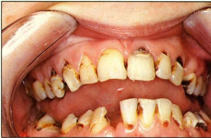
Afb. 1. Een 22-jarige, aan heroïne verslaafde man met typische donkergekleurde cervicale carieslaesies.