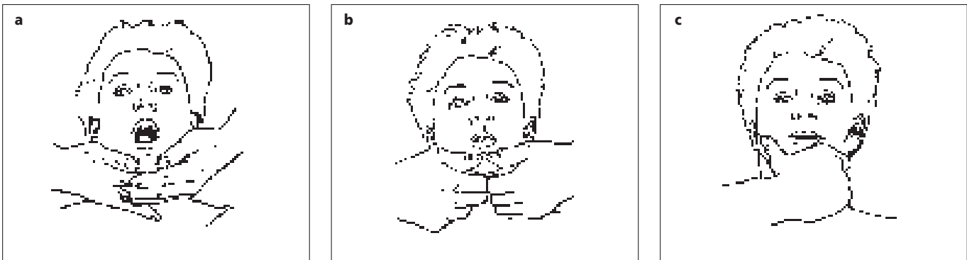
Afb. 4. Dynamische test bij openen (a), sluiten (b) en protrusie (c).

tie is vastgesteld, zal de behandelaar de patiënt de voor- en nadelen van een eventuele behandeling moeten uitleggen. Vervolgens zullen de behandelaar en de patiënt, mede na weging van de behandelingsbehoefte en de behandelingsnoodzaak, besluiten of er wel of niet tot behandeling zal worden overgegaan.