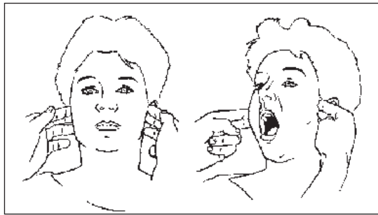
Afb. 2. Laterale palpatie van de kaakgewrichts-regio.

kauwspieren aangetast wanneer de pijn in die spieren onderdeel uitmaakt van een meer algemene, diffuse chronische spierpijn, zoals het geval is bij fibromyalgiepatiënten.