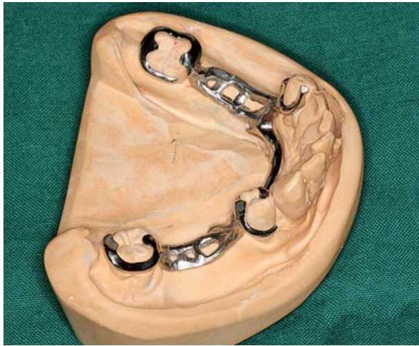
Afb. 1. Minor connectors ter plaatse van geleidingsvlakken distaal van de gebitselementen 33 en 44 en mesiaal van de gebitselementen 38 en 48.

vlak voldoende geacht omdat ook andere delen van het anker die boven de meetlijn liggen, bijdragen aan belasting in de richting van de lengteas van het pijlerelement. Echter, bij ver naar mesiaal gekantelde gebitselementen, hetgeen vaak wordt aangetroffen bij alleenstaande molaren, is het essentieel een distale occlusale steun aan te brengen. In combinatie met de overige delen van het anker wordt hierdoor de kans op verdere kanteling van het gebitselement kleiner.