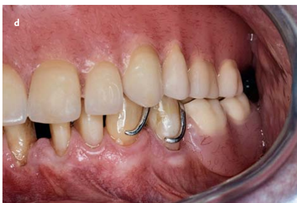
Afb. 3. Esthetisch verantwoorde ankerarmen.