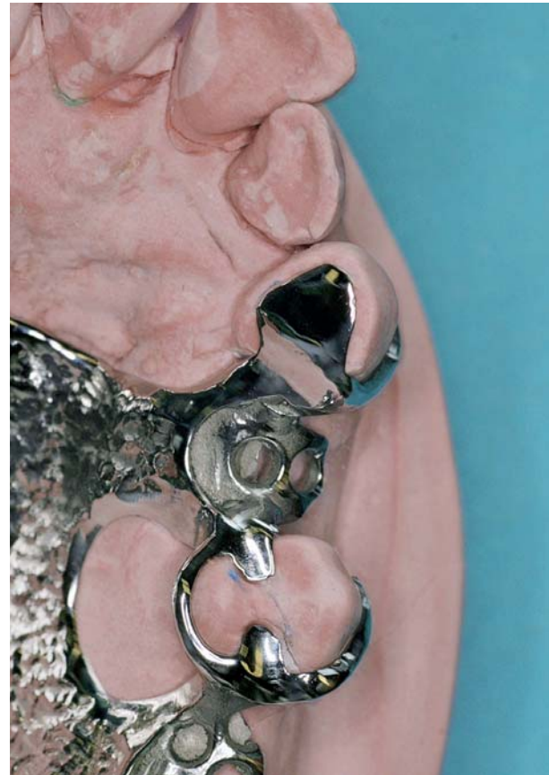
Afb. 2. Een palatinaal plaatje als occlusale steun bij een cuspidaat in de bovenkaak in geval van tekort aan interocclusale ruimte met articulatie over het palatinale vlak.

Eerder is gesteld dat de retentie van een frameprothese niet