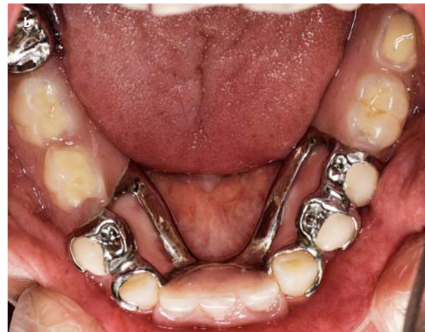
Afb. 4. Beperken van het aantal minor connectors.