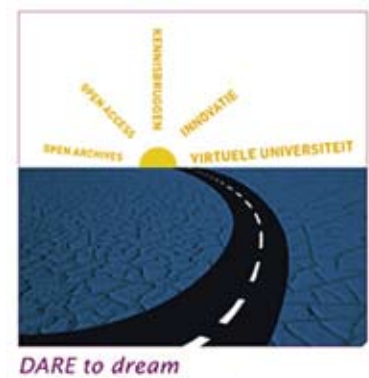
Infrastructuur van het DARE-programma.

Met www.darenet.nl komt men op de homepage. Uit de