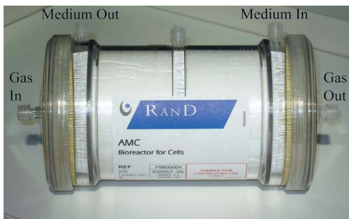
Afb. 2. Zij-aanzicht van de AMC-BAL met in- en uitgang voor medium (cq. plasma) en gas.

Aangezien een leververvangende BAL zeker het equivalent van 15 miljard goed functionerende levercellen moet bevatten, heeft de productie van HepaRG-cellen in grote hoeveelheden onder 'Good Manufacturing Practice' de hoogste prioriteit bij het Amsterdamse onderzoeksteam. Dan ligt de weg open voor een gecontroleerd klinisch onderzoek bij patiënten met ALF en ACLF. Ondertussen doet het AMC onderzoek naar verdere verbetering van de functionaliteit van de BAL door middel van het kweken van hepatocyten in combinatie met non-parenchymcellen, zoals endotheelcellen, Kupffer-cellen en/of mesenchymale stamcellen (Chamuleau et al, 2005; Zinchenko et al, 2006). Tot