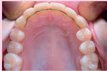
Afb. 3. Overzicht van de bovenkaak, waarbij geen evidente afwijkingen te zien zijn.