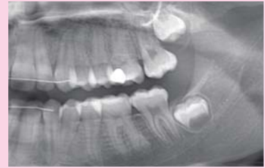
Afb. 4. Uitsnede van de panoramische röntgenopname, waarop een diepe restauratie in gebitselement 26 opvalt.