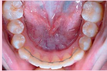
Afb. 2. Overzicht van de onderkaak, waarbij geen evidente afwijkingen te zien zijn.