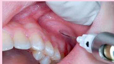
Afb. 7. Lokale anesthesie vestibulair van gebitselement 26.