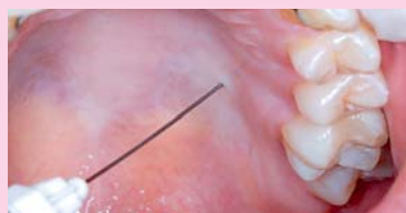
Afb. 8. Lokale anesthesie palatinaal van gebitselement 26.