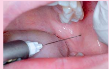
Afb. 5. Mandibulaire blokanesthesie in de mandibula links.

De mka-chirurg stelt als voorlopige diagnose een pijnlijke pulpitis van gebitselement 26. Het meisje en haar vader zijn hiervan heel moeilijk te overtuigen. Om gebitselement 36 als oorzaak uit te sluiten wordt besloten tot het plaatsen van mandibulaire blokanesthesie links. De tongrand en de onderlip raken verdoofd, maar de pijn persisteert (afb. 5 en 6). Dan wordt besloten gebitselement 26 met infiltratie-anesthesie vestibulair en palatinaal te verdoven (afb. 7 en 8). De pijn is verdwenen. Het meisje wordt verwezen naar haar tandarts voor een endodontische behandeling van gebitselement 26 (afb. 9).