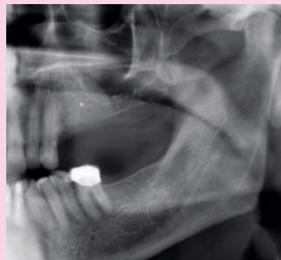
Afb. 11. Uitsnede van de panoramische röntgenopname, waarop in het tweede kwadrant alleen wat restanten van doorgeperst wortelkanaalvulmateriaal te zien zijn, zonder tekenen van ontsteking.

Proefanesthesie kan ook anders worden toegepast en dan bij voorkeur met een langwerkend lokaal anestheticum zoals bupivacaïne (Marcaine™). Bijvoorbeeld: bij pijnklachten aan de linkerzijde van het gelaat blijkt dat na het zetten van een mandibulair blok, ook een proefanesthesie, de pijnklachten persisteren. De diagnostiek in de maxilla wordt bemoeilijkt door kronen en bruggen, die ook nog eens onderling zijn verbonden. De röntgenopname geeft geen uitsluitel. Op het moment van het consult heeft de patiënt geen last van pijn, want die komt altijd in de avond. De tandarts dient in dit geval een hoge tuberanesthesie met bupivacaïne toe. Na verloop van 20 tot 30 minuten is de halve maxilla verdoofd. Deze verdooving zal ongeveer 8 uur aanhouden. De patiënt wordt gevraagd van uur tot uur op te schrijven hoe het met de verdooving is en hoe het met de pijn gaat. Een dag later worden de resultaten besproken en conclusies getrokken. Zie intermezzo 2 met een casus waarin deze proefanesthesie werd toegepast.