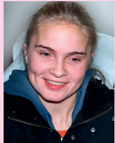
Afb. 9. De patiënt is pijnvrij.