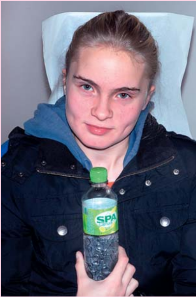
Afb. 1. Patiënt met een flesje koud water, waarmee ze tijdelijk haar pijn verdooft.

Deze neemt een anamnese af en onderzoekt opnieuw het gebit. De pijn is continue aanwezig, straalt uit naar de bovenkaak, bederft haar nachtrust en is moeilijk te lokaliseren. Het kauwen en het nuttigen van warm voedsel beïnvloeden de pijn niet. De pijn neemt kortdurend af door het spoelen met ijskoud water (afb. 1). De bevindingen van de mka-chirurg zijn dat het kaakgewricht, de speekselklieren en de sinus maxillaris geen bijzonderheden vertonen, dat het parodontium gezond is en dat er slechts 1 MO-composietrestauratie van gebitselement 26 is (afb. 2 t/m 4).