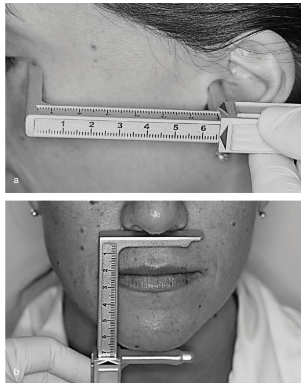
Afb. 2. Meting oog-oor (a) en neus-kin (b).

Omdat de metingen gedaan worden op de zachte weefsels, zijn de gegevens niet hard. De hier voorge-