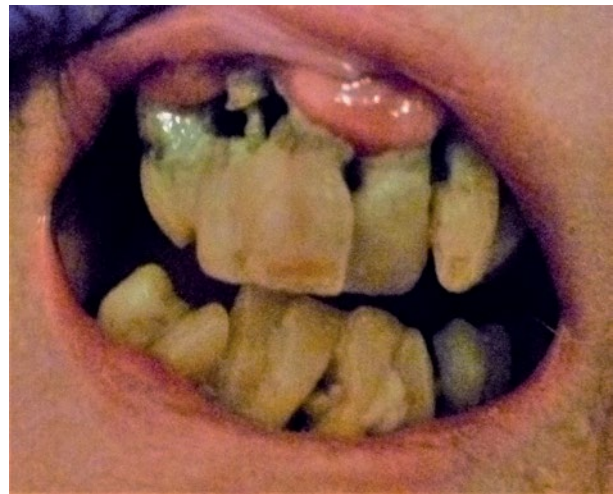
Desolate dentitie bij kwetsbare oudere.

Door wet- en regelgeving inzake de kwaliteit van de zorg in België als Nederland worden bijvoorbeeld ten aanzien van autonomie en weldoen/niet schaden ethische kwesties vermeden. Tijdige communicatie met de patiënt over en diens instemming met de zorg is een wettelijk vereiste (de Wet op de geneeskundige behandelingsovereenkomst in Nederland en de Wet betreffende de rechten van de patiënt in België). Toestemming voor de uitvoering van het zorgplan dient bij wilsonbekwaamheid te worden gegeven door een wettelijk vertegenwoordiger. In de Wet bijzondere opnemingen psychiatrische ziekenhuizen (Nederland) en de Wet betreffende de bescherming van de persoon van de geesteszieke