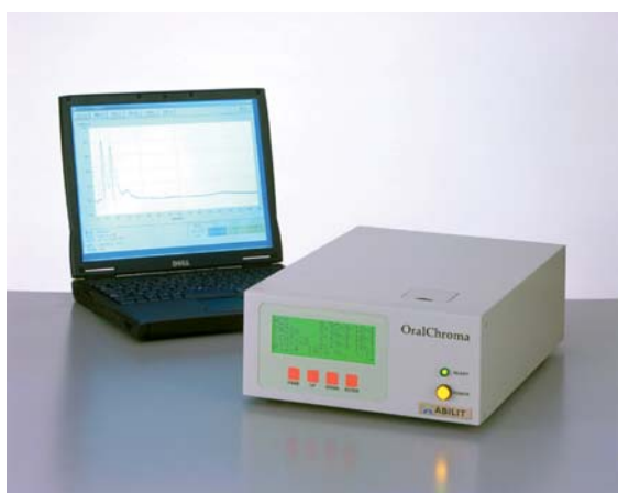
Afb. 4. OralChroma™-apparatuur en bijbehorende software.

op verschillende wijzen worden uitgevoerd. De waarnemer kan recht tegenover of haaks op de patiënt plaatsnemen. De patiënt kan al dan niet actief uitademen of spreken. Het is ook mogelijk de geur in de mond te ruiken met de neus van de waarnemer vlak voor de mond van de patiënt. De persoon in kwestie kan ook door een buisje uitademen, terwijl de waarnemer aan de andere kant van het buisje ruikt (Wigger-Alberti et al, 2010). Naast de mondgeur kan ook het tongbeslag en de neusadem organoleptisch worden gescoord.