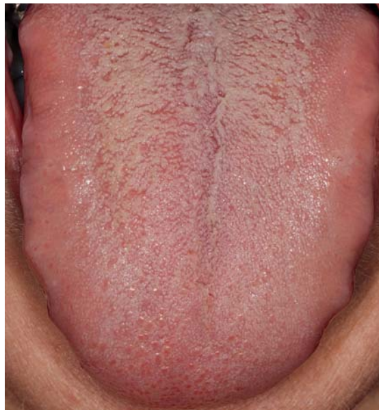
Afb. 1. Tong met tongbeslag.