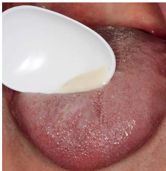
Afb. 2. Losgeschraapt tongbeslag

verduunningsreeksen, door te oefenen op patiënten en met behulp van een gestandaardiseerde geurtest (Sensonics®, www.sensonics.com). De gebruiker moet 40 uiteenlopende geuren identificeren en zo wordt het reukvermogen getest. Deze test biedt tevens de mogelijkheid een eventueel gebrek aan reukvermogen (anosmie) vast te stellen.