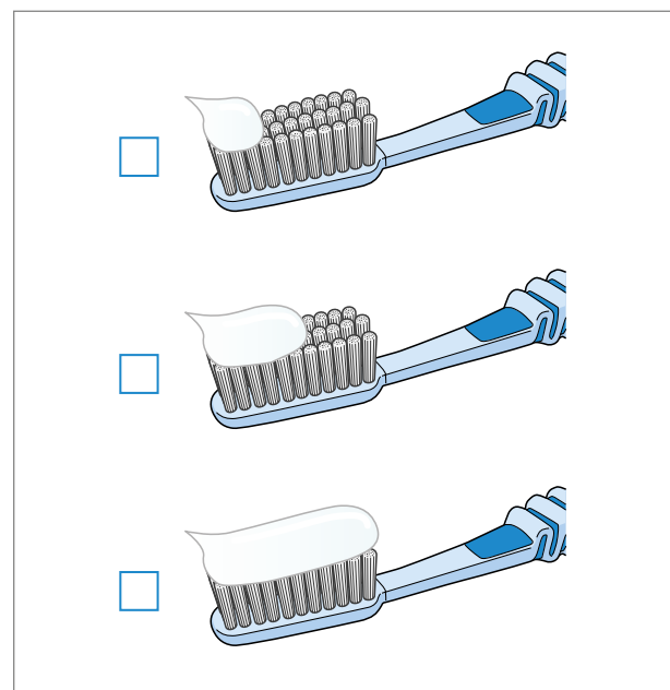
Afb. 1. De 3 verschillende hoeveelheden tandpasta op de borstel.

In 68% van de gevallen bleek het gewicht van de tandpasta op de tandenborstel hoog ( > 0,3 g), zeker omdat de categorieën 'alleen bedekt' en 'volledig bedekt' geen statistisch verschil vertoonden ( p > 0,05 ). De mate van overeen-