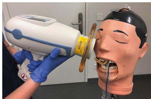
Afb. 1. Nomad Pro 2 met proefopstelling.

De resultaten lieten een vergelijkbare beeldkwaliteit