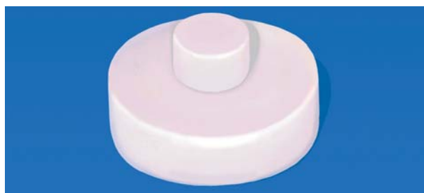
Afb. 1. Composietschijfje waarop een tweede schijfje is gehecht.

Groep 3. Idem na een wachttijd van 4 weken.