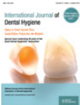
International Journal of Dental Hygiene 2012; 10: 147-237 Special issue celebrating 45 years of the Dutch Dental Hygienists' Association www.wileyonlinelibrary.com/journal/idh