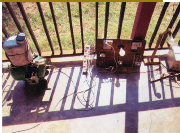
Ondersteunende apparatuur bij een mondzorgklinikje in Myanmar (Burma).

De eerste stap naar effectievere zorgverlening is de bereidheid in te zien dat het traditionele westerse model soms goede resultaten oplevert, maar ook beperkingen kent en zelfs schadelijke aspecten kan hebben voor het lokale