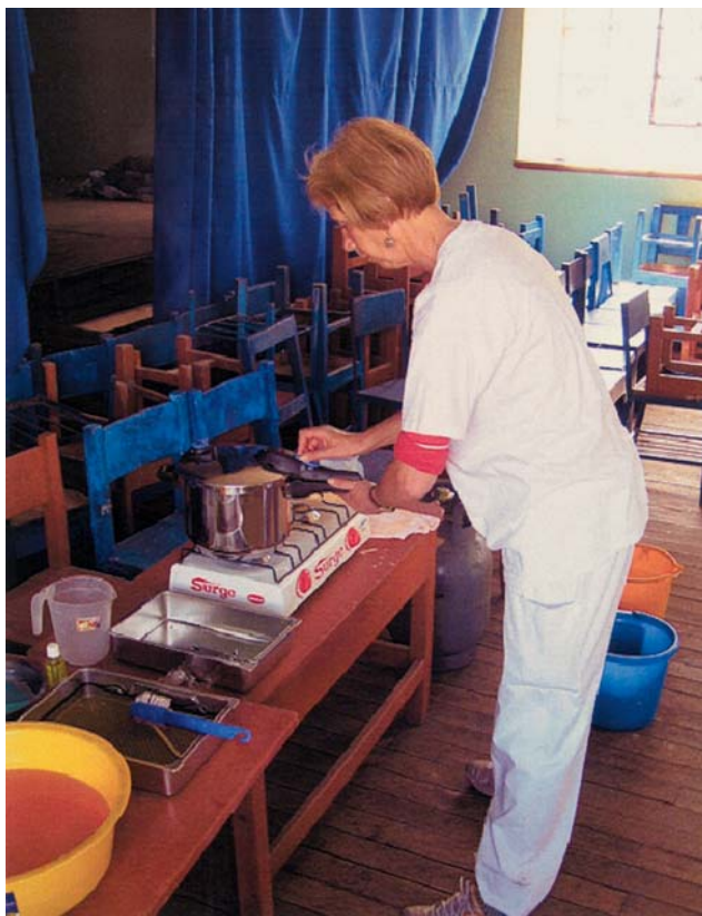
Sterilisatietafel (Dentamig in Peru).

niet verandert. Om deze redenen wordt in internationale resoluties gesteld dat het cariësprobleem niet met een restauratieve benadering is op te lossen (World Health Organization, 2007).