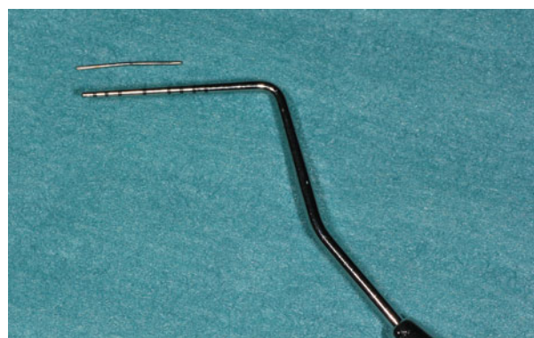
Afb. 6. Het verwijderde naaldje met een lengte van 9 mm naast een pocketsonde.