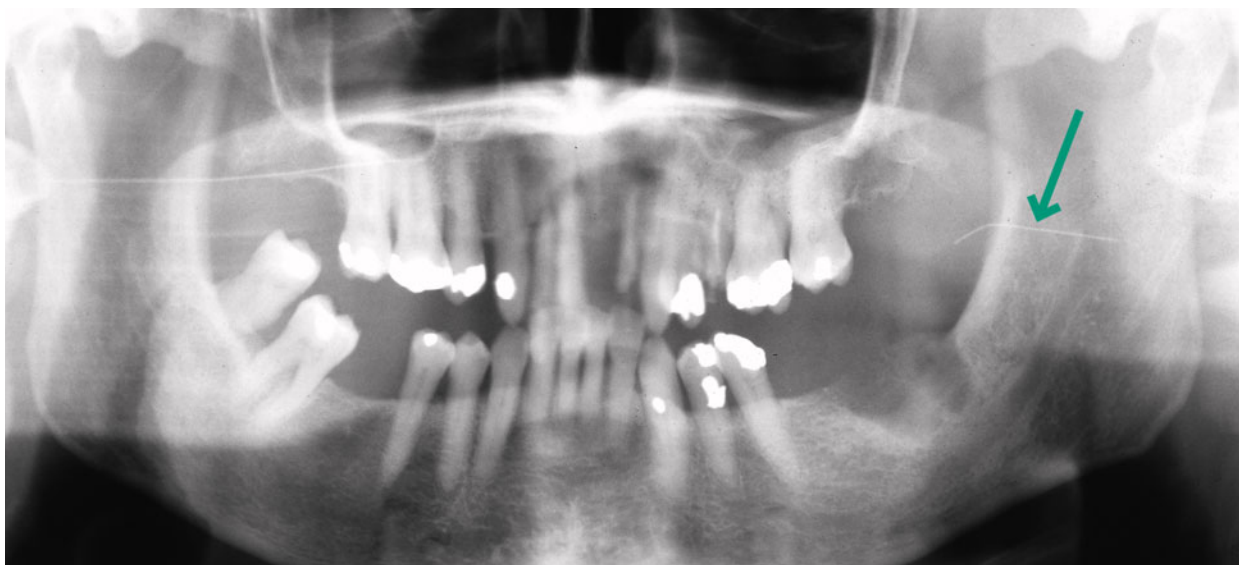
Afb. 1. De panoramische röntgenopname toont de afgebroken naald na mandibulair blokanesthesie links.

Bij intraorale inspectie was sprake van een extractiewond ter hoogte van gebitselement 26. Het naaldje bleek niet te palperen. Op de meegeleverde tandfilm was een klein deel van het naaldje zichtbaar in de regio van gebitselementen 26 en 27 (afb. 2). Om een betere 3D-lokalisatie van het naaldje te verkrijgen, werd besloten een partieel conebeamcomputertomogram (CBCT) te vervaardigen. Hierop was een dun naaldje zichtbaar met een afmeting van 8-9 mm ter hoogte van de crista zygomatico alveolaris links (afb. 3 en 4).