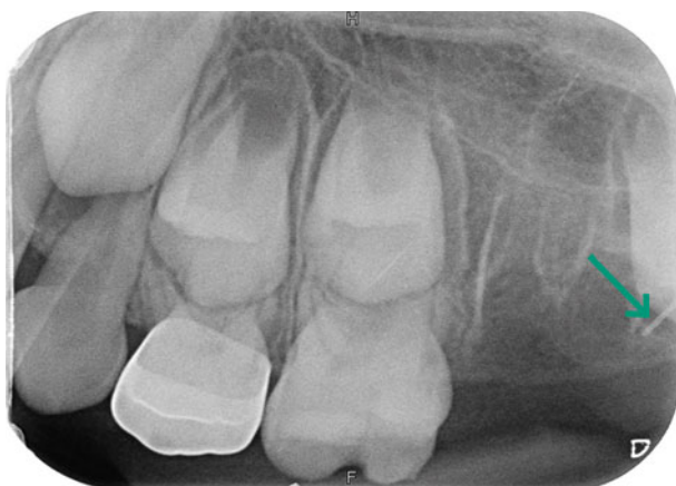
Afb. 2. De röntgenopname toont een deel van het afgebroken naaldje in de regio van gebitselement 27.

Naaldbreuk na lokale anesthesie in de tandheelkunde is