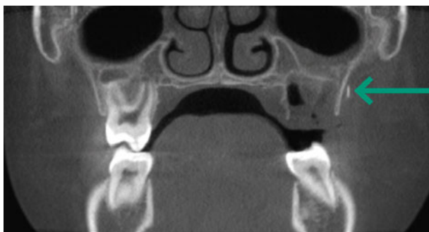
Afb. 3. Een coronale coupe van de CBCT-scan toont het naaldje gelegen tegen de crista zygomatico alveolare links.