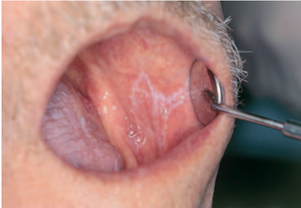
Afb. 6. Licht pijnlijke lichen planus van het wangslimvlies. Ook op de tong is lichen planus zichtbaar.

met implantaten worden overwogen (Raghoobar et al, 2004a, Raghoobar et al, 2004b).