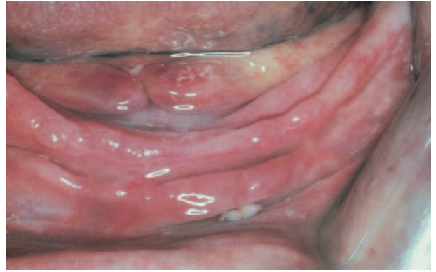
Afb. 2. Pijnlijke 'flabby ridge' in het onderfront.

gebitsprothese' te vaak veel energie gestopt in het verhogen van de retentiekrachten. Dit blijft niet zelden zonder succes en daarmee blijft ook de kans op steeds weer optredende pijn bestaan. Vaak is een beter resultaat te behalen door de krachten die een negatieve invloed hebben op de stabiliteit te reduceren of weg te nemen (Van Os et al, 1998).