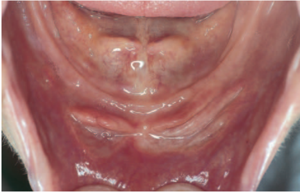
Afb. 1. Pijnlijk irritatiefibroom in het onderfront door een te lange protheserand.