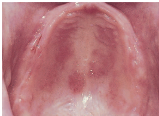
Afb. 3. Licht pijnlijke lokale stomatitis prothetica in de bovenkaak door een slecht passende gebitsprothese.