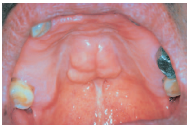
Afb. 5. Grote en gelobde torus palatinus in een pre-edentate mond.

Pijnklachten door anatomische bijzonderheden van het kaakbot kunnen worden behandeld door de gebitsprothese ter plaatse te ontlasten. In lastigere gevallen waarbij prothetische aanpassingen onvoldoende soelaas bieden, kan een chirurgische correctie en eventueel een behandeling