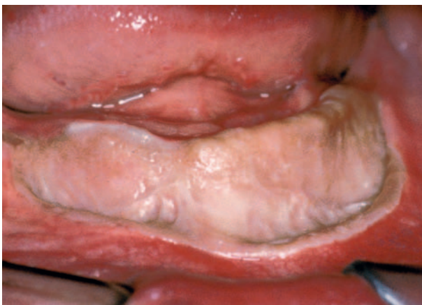
Afb. 8. In de onderkaak is in het verleden een omslagplooi-verdieping met behulp van een vrij huidtransplantaat uitgevoerd (met dank aan prof. dr. G.M. Raghoobar).

Andere in en rond een edentate (oudere) mond voorkomende, niet aan een gebitsprothese gerelateerde slijmvliesafwijkingen die pijn kunnen veroorzaken zijn: afte, herpes simplex, herpes zoster, (erosieve) lichen planus (afb. 6),