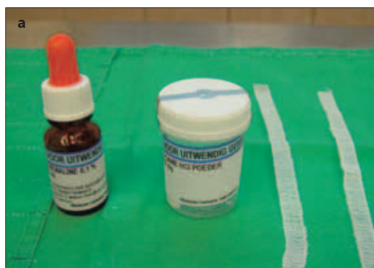
Afb. 1a en b. Impregneren van gaasstroken met een mengsel van cocaïne en adrenaline.

Een Le Fort I-osteotomie kan leiden tot aanzienlijk bloedverlies (Dolman et al , 2000; Stewart et al , 2001). Naast het risico van een laesie van een arterie is één van de oorzaken het losprepareren van het neusslijmvlies van het benige caudale deel van de neusholte. Daar dit neusslijmvlies zeer goed doorbloed is, treedt hierdoor betrekkelijk veel diffuus bloedverlies op. Wellicht valt dit bloedverlies te beperken door lokale applicatie van cocaïne.