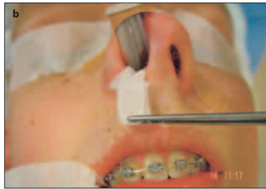
Afb. 2a en b. Na intubatie aanbrengen van de geïmpregneerde gaasstroken in beide neusgaten.

Door middel van een pilotonderzoek werd gepoogd te beoordelen of het zinvol is een prospectief onderzoek op te zetten naar het verminderen van bloedverlies tijdens een Le Fort I-osteotomie door applicatie van een mengsel van cocaïne en adrenaline op de neusbodem.