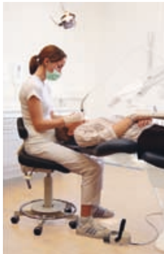
Afb. 1. Een gezonde werkhouding: symmetrisch rechtop zittend met licht gebogen hoofd, de bovenarmen naast het lichaam, de onderarmen licht geheven en een hoek van 110°. Tussen onder- en bovenbenen (Uit: IQual-programma van de NMT).

Thans hebben tandarts-ondernemers en de opleidingen tandheelkunde een zorgplicht voor hun werknemers vastgelegd in de Arbeidsomstandighedenwet die aansluit op de wetgeving van de Europese Unie over veiligheid en gezondheid ( Arbeidsomstandighedenwet , 2007). Dit betekent het zorgdragen voor een werkomgeving die een veilige en gezonde werkwijze mogelijk maakt, het verzorgen van de daarvoor benodigde opleiding en het toetsen hiervan.