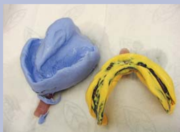
Afb. 2. Afdrukken voor nieuwe obturatorprothese en nieuwe conventionele onderprothese.