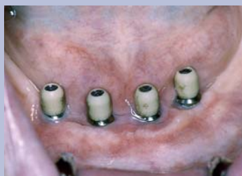
Afb. 4. Implantsaatsopbouw met beschermkappen.

De man was blij dat hij toestemming had gegeven voor de behandeling, waartegen hij wel erg had opgezien. De vele reizen naar de diverse zorgverleners had hij als een grote belasting ervaren, maar op de vraag of hij ook toestemming had gegeven als hij alle voor- en nadelen tevoren had kunnen overzien, antwoordde hij volmondig ja. Het resultaat ervoer hij als een weldaad en dus als een verhoging van zijn levenskwaliteit.