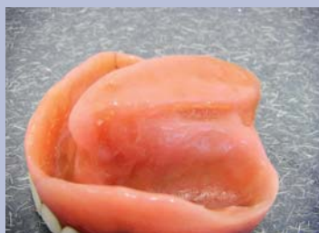
Afb. 1. Obturatorprothese.

Evaluerend kan worden gezegd dat een ogenschijnlijk eenvoudige zorgvraag een bijzondere complexe zorgvraag bleek te zijn. Echter, het uiteindelijke resultaat was toch een acceptabele mondgezondheid van een zeer kwetsbare oude vrouw. De behandeling heeft vermoedelijk een belangrijke bijdrage geleverd aan de kwaliteit van haar laatste levensperiode. Dit resultaat kon worden bereikt door goed overleg met en betrokkenheid en begrip van de specialist ouderengeneeskunde, de verzorgenden en de familieleden.