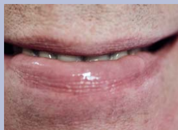
Afb. 6. Gebitsprothesen geplaatst. Optimaal ondersteunde en erg vochtige onderlip.