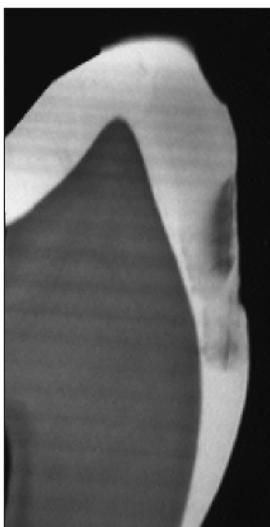
Afb 2. Microradiogram van een slijpcoupe van een gebitselement met een proximale cariëslaesie.