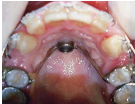
Afb. 3. Gebitselementen 14 en 24 zijn geëxtraheerd. De cuspidaten worden getraheerd. Gebitselementen 15 en 25 zijn met een palatinale bar gefixeerd aan het palatinaal implantaat. Hiermee wordt mesialiseren van de zijdelingse delen tijdens het retraheren van de cuspidaten voorkomen.

implantaat weer worden verwijderd. Er wordt een geleidestaaf op het implantaat gezet en het omliggende bot wordt met een passende cilindrische boor verwijderd. Dit resulteert in een fors botdefect. Een alternatief is minimale verwijdering van bot rondom het implantaat, gecombineerd met het op gecontroleerde wijze uitdraaien van het implantaat. Naast de nadelen van de tijdrovende laboratoriumwerkzaamheden en het trauma dat bij de verwijdering ontstaat, is het werken met een palatinaal implantaat niet bepaald ergonomisch te noemen en bestaat het risico van aspiratie. Het voordeel van een palatinaal implantaat ten opzichte van een 'gewoon' oraal implantaat is evenwel de goede toepasbaarheid bij patiënten met een volledige tandboog.