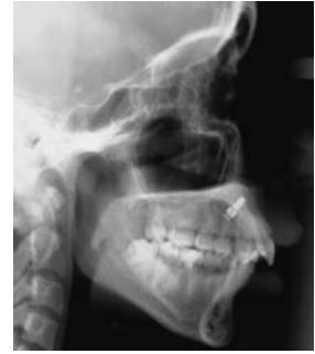
Afb. 2. Palatinaal implantaat zichtbaar op röntgenschedelprofielopname.