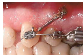
Afb. 5. Klasse II-relatie.