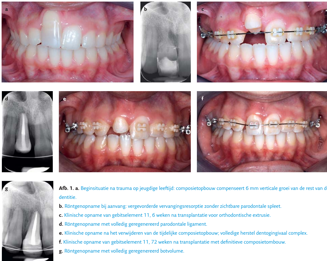
Afb. 1. a. Beginsituatie na trauma op jeugdige leeftijd: composietopbouw compenseert 6 mm verticale groei van de rest van de dentitie. b. Röntgenopname bij aanvang: vergevorderde vervangingsresorptie zonder zichtbare parodontale spleet. c. Klinische opname van gebitselement 11, 6 weken na transplantatie voor orthodontische extrusie. d. Röntgenopname met volledig geregenereerd parodontale ligament. e. Klinische opname na het verwijderen van de tijdelijke composietopbouw; volledige herstel dentogingivaal complex. f. Klinische opname van gebitselement 11, 72 weken na transplantatie met definitieve composietombouw. g. Röntgenopname met volledig geregenereerd botvolume.

stadium van de gebitselementen met niet-afgevormde apices werd Andreasen et al (1990) aangehouden, waar transplantatie werd geïndiceerd vanaf tweede derde lengte van de wortelontwikkeling. De genezing bij open apices werd vooral door de endodontologen in de groep gevolgd. Door de revascularisatie van het pulpaweefsel (gekenmerkt door obliteratie van de pulpakamer) wordt het gebitselement op de receptorlocatie vitaal, maar niet sensibel.