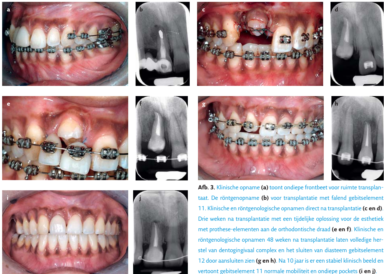
Afb. 3. Klinische opname (a) toont ondiepe frontbeet voor ruimte transplantaat. De röntgenopname (b) voor transplantatie met falend gebitselement 11. Klinische en röntgenologische opnamen direct na transplantatie (c en d). Drie weken na transplantatie met een tijdelijke oplossing voor de esthetiek met prothese-elementen aan de orthodontische draad (e en f). Klinische en röntgenologische opnamen 48 weken na transplantatie laten volledige herstel van dentogingivaal complex en het sluiten van diasteem gebitselement 12 door aansluiten zien (g en h). Na 10 jaar is er een stabiel klinisch beeld en vertoont gebitselement 11 normale mobiliteit en ondiepe pockets (i en j).

succespercentage van 93% gerapporteerd. De meest getransplanteerde gebitselementen waren de tweede en eerste premolaren. Daarop volgden de derde molaren in de bovenkaak. Premolaren vonden bij 29% van de gevallen een plaats op een incisieflocatie (bovenfront). Bij 65% van de transplantaties was die naar een locatie in de premo-laarstreek. Molaren hebben als voorkeursgebied de premo-laar- en molaarstrekken, hoewel 1 derde molaar zijn weg vond naar het front. Cuspidaten werden vooralsnog alleen op hun eigen locatie teruggeplaatst en onderincisieven vonden een plaats in het bovenfront (tab. 1).