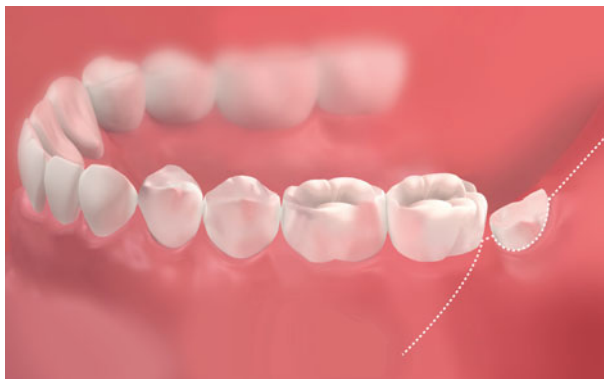
Afb. 6. Buccaal aanzicht van een flapincisie: een distale incisie met buccale ontspanningsincisie.

Bij het verwijderen van een mesiaal geïmpacteerde derde molaar kozen de meeste behandelaars voor de flapincisie (44%), gevolgd door de distale incisie (29%), de envelopincisie (14%) en ten slotte voor de gemodificeerde envelopincisie (5%). Een alternatieve incisie of een combinatie van incisies werd door 15 behandelaars (8%) gebruikt. Bij het verwijderen van een rechtstandig geïmpacteerde derde molaar werd gekozen voor respectievelijk de distale incisie (48%), de flapincisie (33%), de envelo-