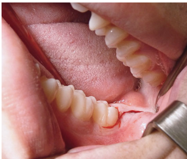
Afb. 3. Distale incisie.