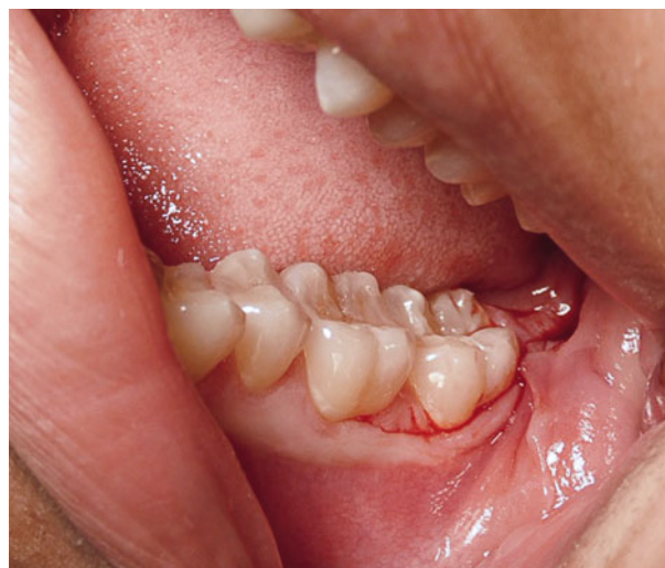
Afb. 4. Gemodificeerde envelopincisie.

ren. Een nadeel is dat deze incisie van de 4 incisies de minste exposure geeft. Eventueel kan de distale incisie nog wel uitgebreid worden tot de flapincisie/envelopincisie bij een onverwacht lastige verwijdering van een derde molaar, zoals afbreken of ongunstige splitsing van de kroon. Afhankelijk van de ligging van de derde molaar en de voorkeur van de behandelaar zal een keuze worden gemaakt voor de te gebruiken incisie. Het is echter onduidelijk in welke mate de specifieke incisietechnieken worden gebruikt. Dit vormde de aanleiding voor het hier beschreven onderzoek.