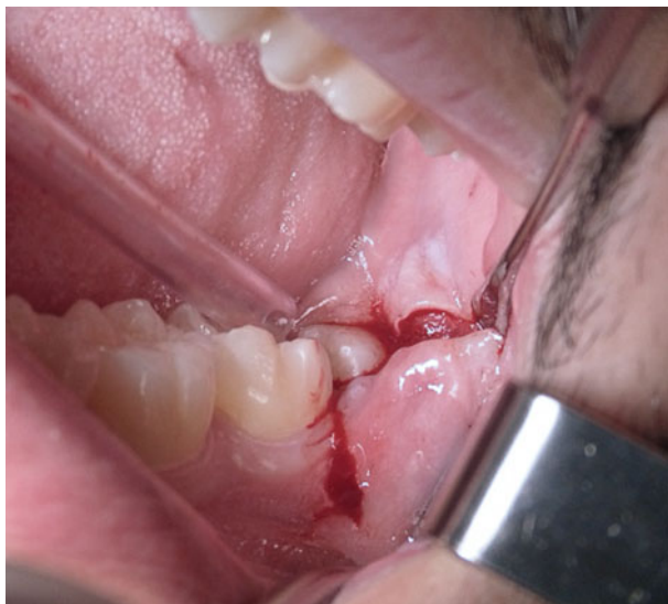
Afb. 1. Flapincisie.