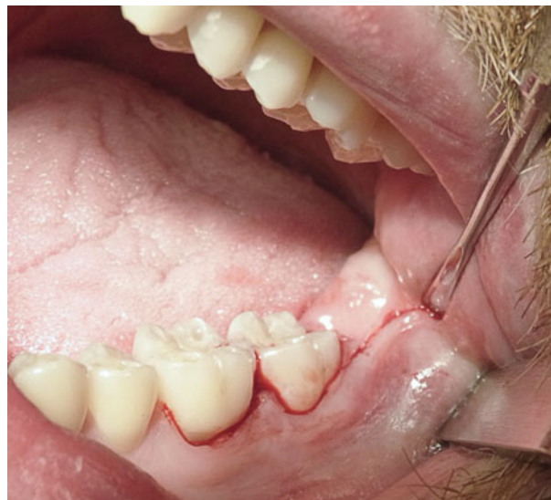
Afb. 2. Envelopincisie.