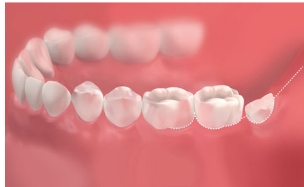
Afb. 7. Buccaal aanzicht van een envelopincisie: een distale incisie én door sulcus gingivalis van de eerste en tweede molaar.